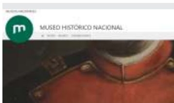
Juana Azurduy: la Revolución con olor a jazmín

https://www.cultura.gob.ar/quien-fue-juana-azurduy-y-por-que-es-una-la-heroína-popular-8813/